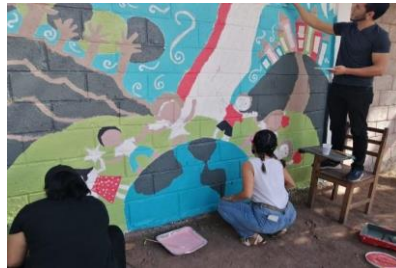
Decálogo de normas de convivencia